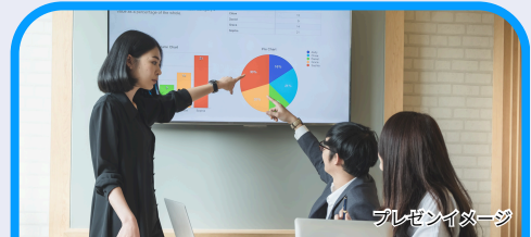
プレゼンテーションイメージ