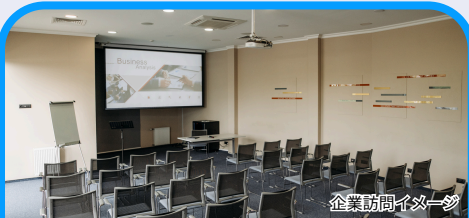
企業訪問イメージ