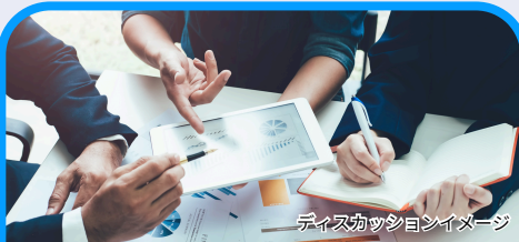
ディスカッションイメージ